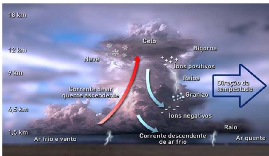
Figura 2 - Formação de uma nuvem de tempestade de raios (INPE).

De acordo com o Instituto Nacional de Pesquisas Espaciais, as nuvens se formam a partir da condensação do vapor d'água existente na atmosfera, que formam gotículas de água. Em altitudes maiores, a temperatura cai e as gotículas adquirem temperaturas menores que 0°C e podem se tornar partículas de gelo.