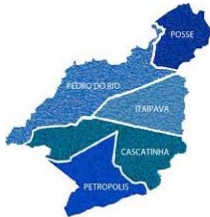
Figura 1 - Representação de Petrópolis com seus respectivos distritos (Plano Diretor de Petrópolis, 2014).

Petrópolis apresenta um clima quente e temperado. Existe uma pluviosidade significativa ao longo do ano. A temperatura média é de 18.4°C. No mês de fevereiro, o mês mais quente do ano, a temperatura média é de 21.7°C. A temperatura média em julho, é de 15.2°C. A pluviosidade média anual é de 1929mm. O mês mais seco é julho e tem 56 mm de precipitação. O mês de maior precipitação é dezembro, com uma média de 307 mm.